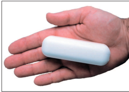
Abb. 1 Ca-PILL® „biologische“ Kalziumpille

Die Befunde wurden zunächst mit Hilfe des natürlichen Logarithmus umgeformt, um sie einer Normalverteilung anzunähern. Die Beschreibung der Befunde (deskriptive Statistik) erfolgte durch geometrische Mittelwerte und Standardfehler (8) für Fall- und Kontrollgruppe. Danach wurde mittels Varianzanalyse (9) geprüft, inwiefern sich Fall- und Kontrollgruppe unterschieden (induktive Statis-